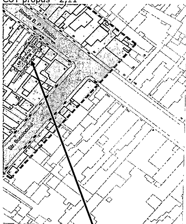
Extras HCL nr. 168/2009