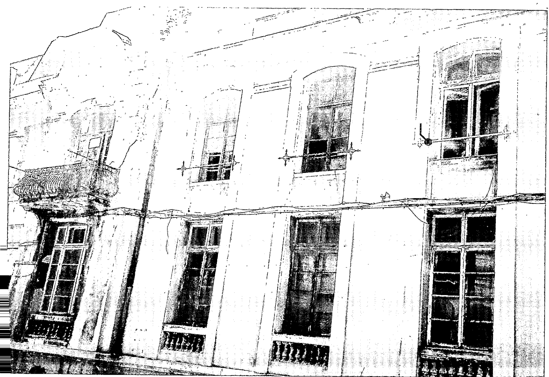
Str. Arhiepiscopiei nr. 22