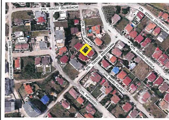
INCADRARE IN ZONA